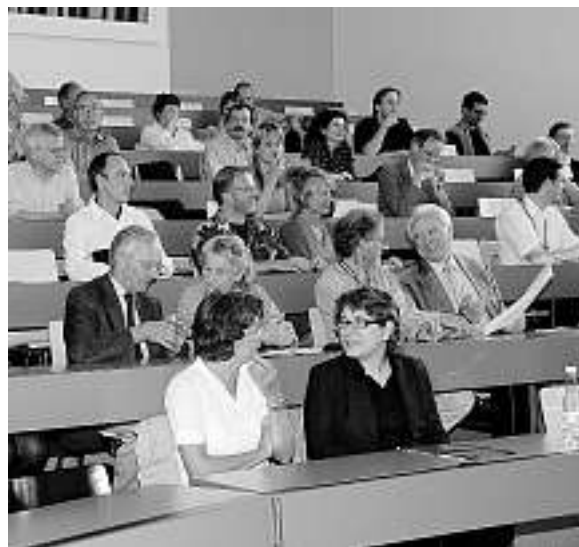
Alumnae und Alumni am Alumnitag 2007.

Damit man sich auch zwischendurch an Alumni erinnert, haben wir pünktlich zum Alumnitag 2007 ein Schlüsselband kreiert. Das praktische Teil ist in zwei Längen erhältlich und kann zum Preis von CHF 5.– bei Eva Nydegger, Öffentlichkeitsarbeit der Universität Basel, am Petersplatz 1 bezogen werden. Der Erlös dient einerseits zur Deckung der Produktionskosten, was darüber hinaus übrigbleibt, dient der Finanzierung von Alumniaktivitäten an der Uni Basel.