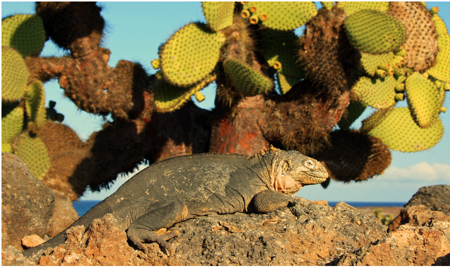
Landleguan auf Galapagos