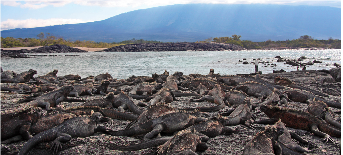
Meerechsenkolonie am Punta Espinosa, Insel Fernandina

gung in der Hauptstadt. Am Abend erwartet uns ein Abschiedessen, während dem wir die Erlebnisse der bisherigen Stationen unserer Reise noch einmal Revue passieren lassen. Eine Übernachtung bei Quito.