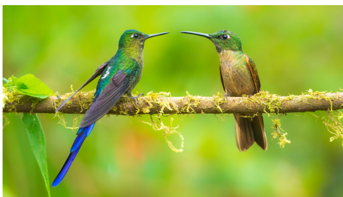
Langschwanzsylphen im Nebelwald

Früh Aufstehen lohnt sich! Schon der Morgen auf der Terrasse unserer Lodge wird uns verzaubern: Schillernde Kolibris schwirren um unsere Köpfe, und eine Vielzahl an Vogelarten sind im Morgengrauen aktiv. In Paz de los Aves, einem Vogelparadies, dem Choco-Andino Biosphären-Reservat zugehörig, werden wir durch kundige lokale Führer geleitet und einen unvergesslichen Einblick in die Vielfalt der Vogelwelt erhalten. Tukane mit ihren mächtigen Schnäbeln, farbenfrohe Tangaren, unzählige Kolibris und mit Glück sogar der mystische, leuchtend orange gefärbte Felsenhahn, erwarten uns.