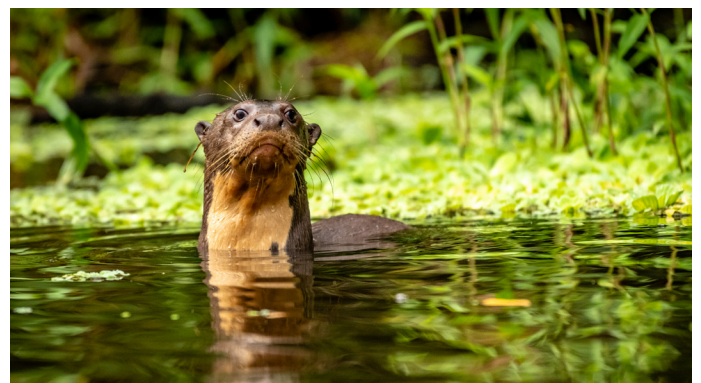
Riesenotter im Yasuni-Nationalpark