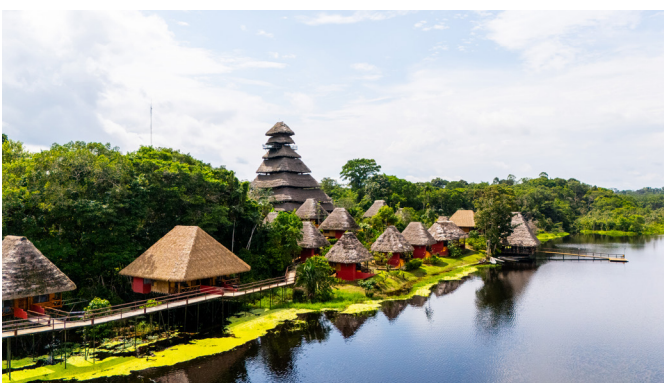
Unsere Lodge im Amazonas

Wir verlassen den Regenwald, und im motorisierten Kanu geht es nach Coca, von wo wir nach Quito fliegen. Je nach Ankunft bleibt noch Zeit für die eine oder andere Besichti-