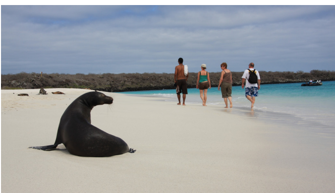
Die Tierwelt auf Galapagos kennt keine Scheu vor dem Menschen

Am Vormittag erkunden wir die an der Nordküste der Insel Isabela gelegene zerklüftete, junge Lavabucht von Punta Moreno, die selten von Touristen besucht wird. Hier bezaubern einzigartige Lagunen, die von Flamingos und vielen anderen Wasservögeln besucht werden. Bei guter Sicht eröffnet sich der Blick auf die drei aktiven Vulkane der Galapagos-Inseln, Cerro Azule, La Cumbre und Sierra Negra.