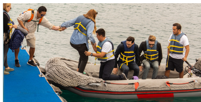
Die Ausflüge finden in Schlauchbooten statt