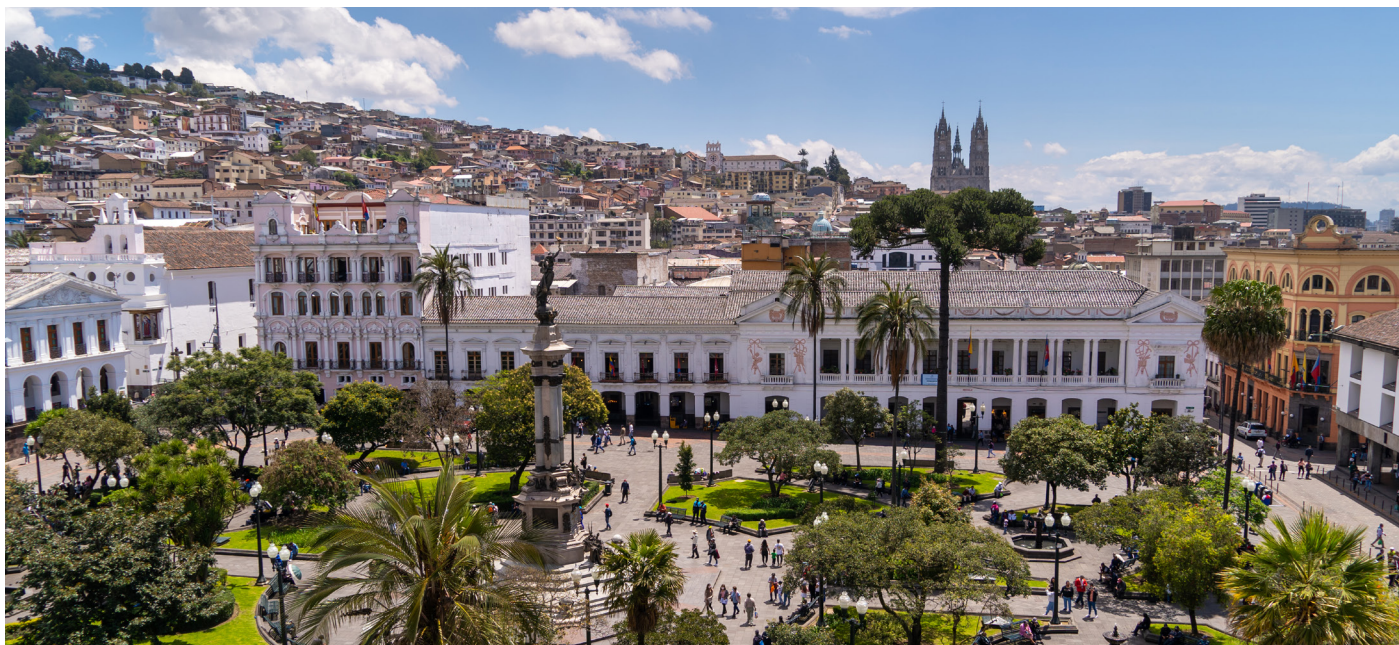
Aussicht auf das koloniale Zentrum von Quito