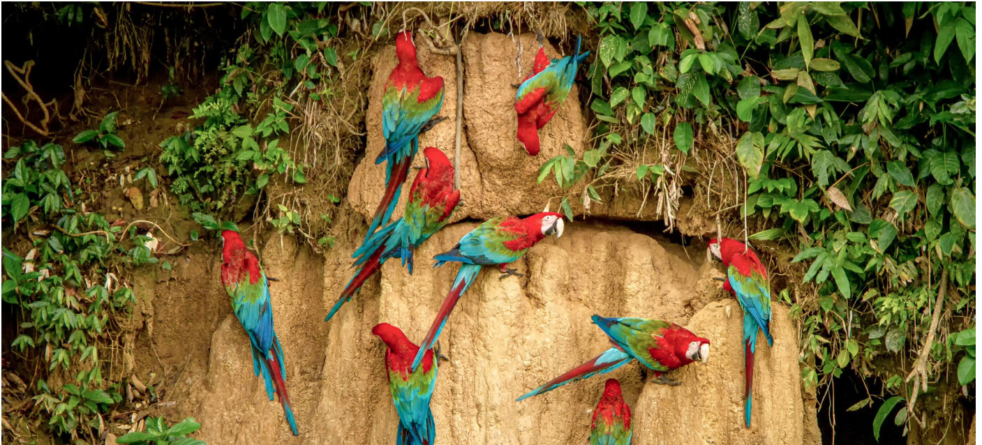
Dunkelrote Aras im Amazonas