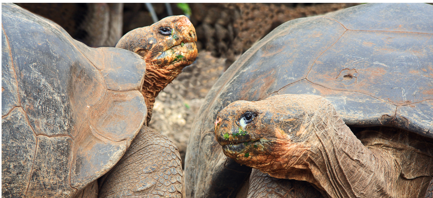
Riesenschildkröten in der Charles Darwin Station, Insel Santa Cruz