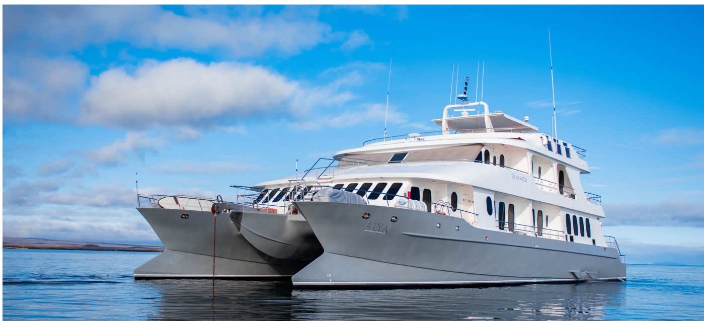
Der Katamaran «Alya» auf Galapagos ist exklusiv für unsere Gruppe reserviert