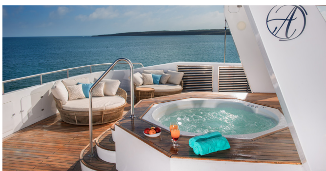
Sonnendeck mit Jacuzzi

Kabinen mit 16 m 2 , Doppel- oder 2 Einzelbetten, kleiner privater Balkon