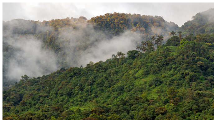
Der Mindo-Nambillo Nebelwald